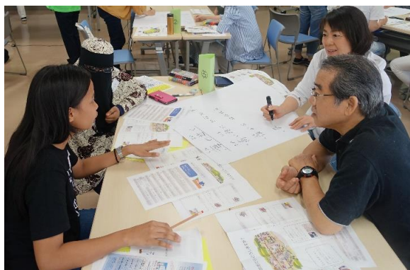
【外国人学習支援センターでのやさしい日本語を使った防災訓練の風景】

やさしい日本語は、外国人のためだけではなくありません。伝えたいことを明確に伝えるスキルを磨くことによって、社内のコミュニケーション活性化にも役立ちます。会社力アップのために、やさしい日本語研修を取り入れてみませんか？